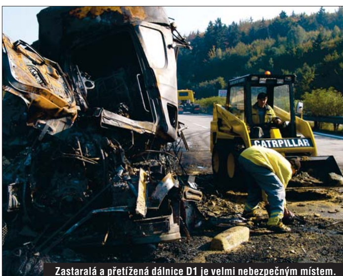
Zastaralá a přetížená dálnice D1 je velmi nebezpečným místem. Na podzim zde shořely hned tři kamiony.

Přes tyto drobnosti ale cvičení Horizont 2004 prokázalo, že se krajové obyvatelé dokáží rychle a účinně postarat. „Jaderná elektrárna Dukovany představuje v kraji papírové riziko, ale reálnější je předpoklad kolapsu například na dálnici D1, s havárií, která ohrožuje životní prostředí. Nemusíme chodit daleko, nedávne